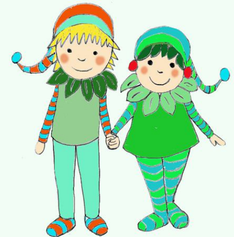
TARELLA de PIMS